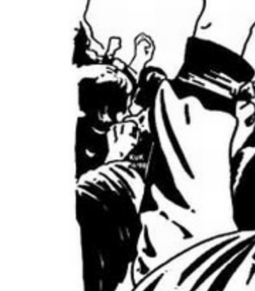
یک گروه از دانشجویان در یک تظاهرات در فرانسه، ۱۹۶۸.

آنها دامن زدند)، مارکسیسم یک پیشگویی تاریخی است و….