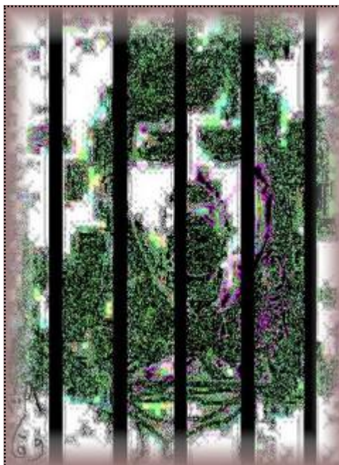
زن زندانی - اثر اسماعیل وفا

قلبی و رماتیسم حاد رنج برده و بدون کمک، به سختی می‌تواند راه برود. مسئولان بهداری زندان به بهانه نبود تسهیلات مناسب، از درمان وی خودداری کرده و از انتقال و درمان او در مراکز پزشکی، حتی با هزینه خانواده اش، جلوگیری