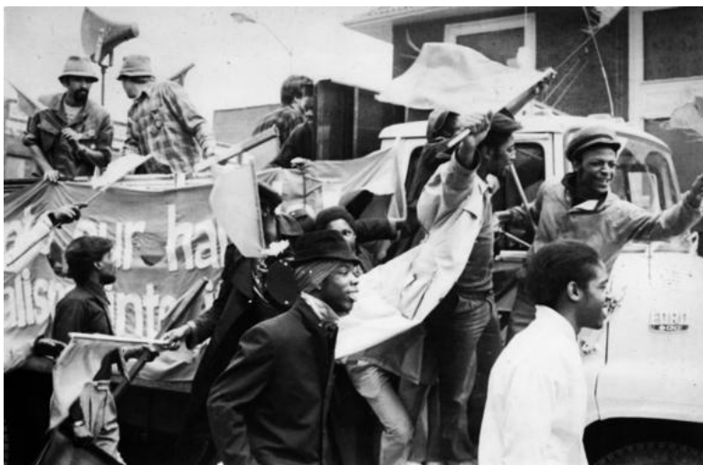
اول ماه مه 1980 شهر دیترویت ایالت میشگان آمریکا

انترناسیونالیسم همواره مشخصه انقلاب کمونیستی بوده است، و درک قوی تر از این مشخصه، و تاکید بر آن، بخش مهمی از سنتز جدید کمونیسم است که معتقد است: تمام جهان مقدم است!